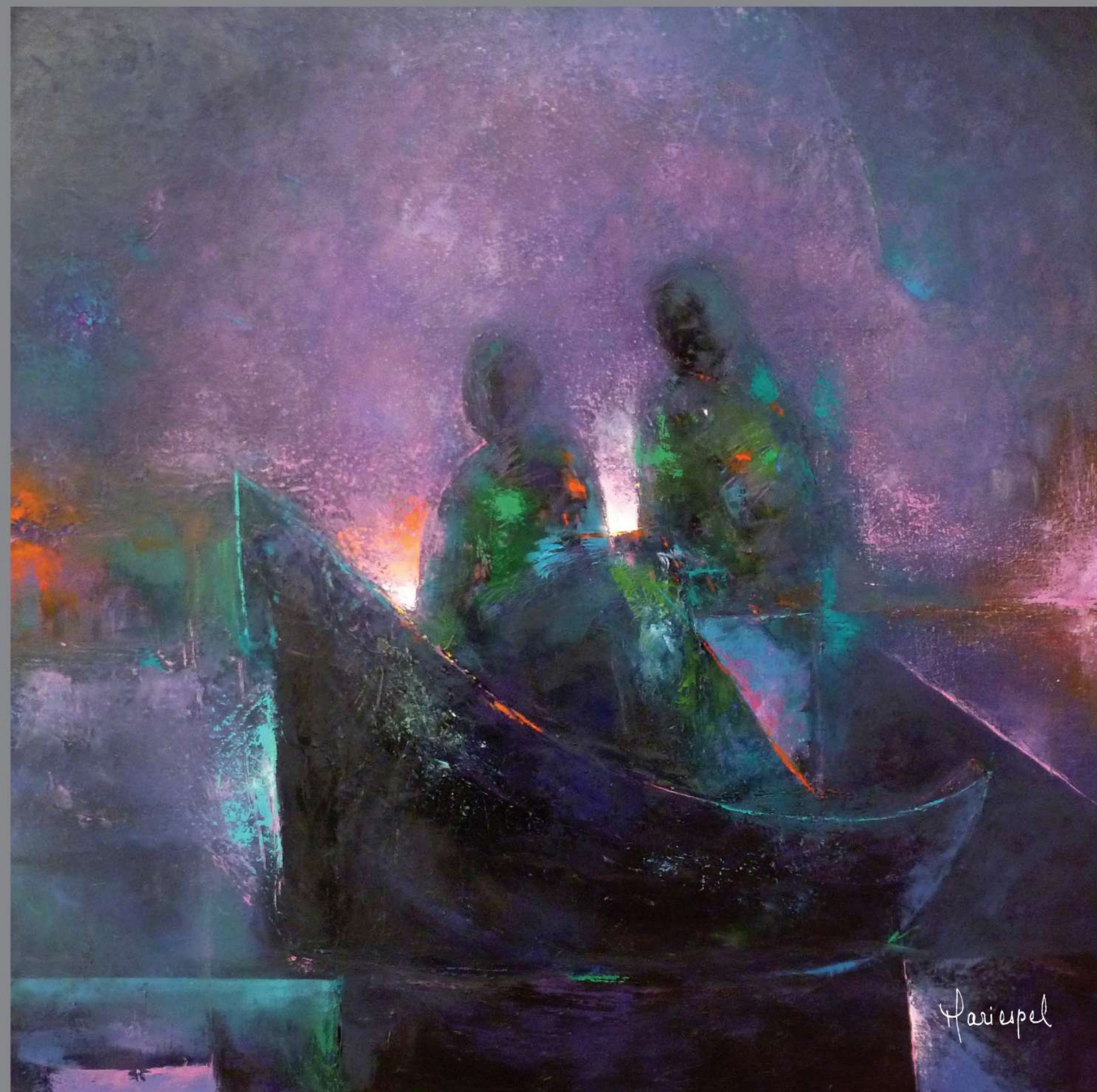
TESTIMONIO II 2011 Óleo sobre lienzo 100 x 100 cms.