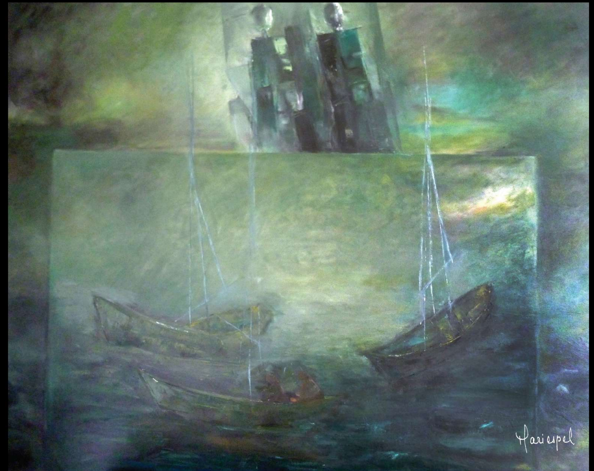
EN EL SILENCIO DEL MAR, BUSCANDO UN SENTIDO DE VIDA 2010 Óleo sobre lienzo 110 x 140 cms.