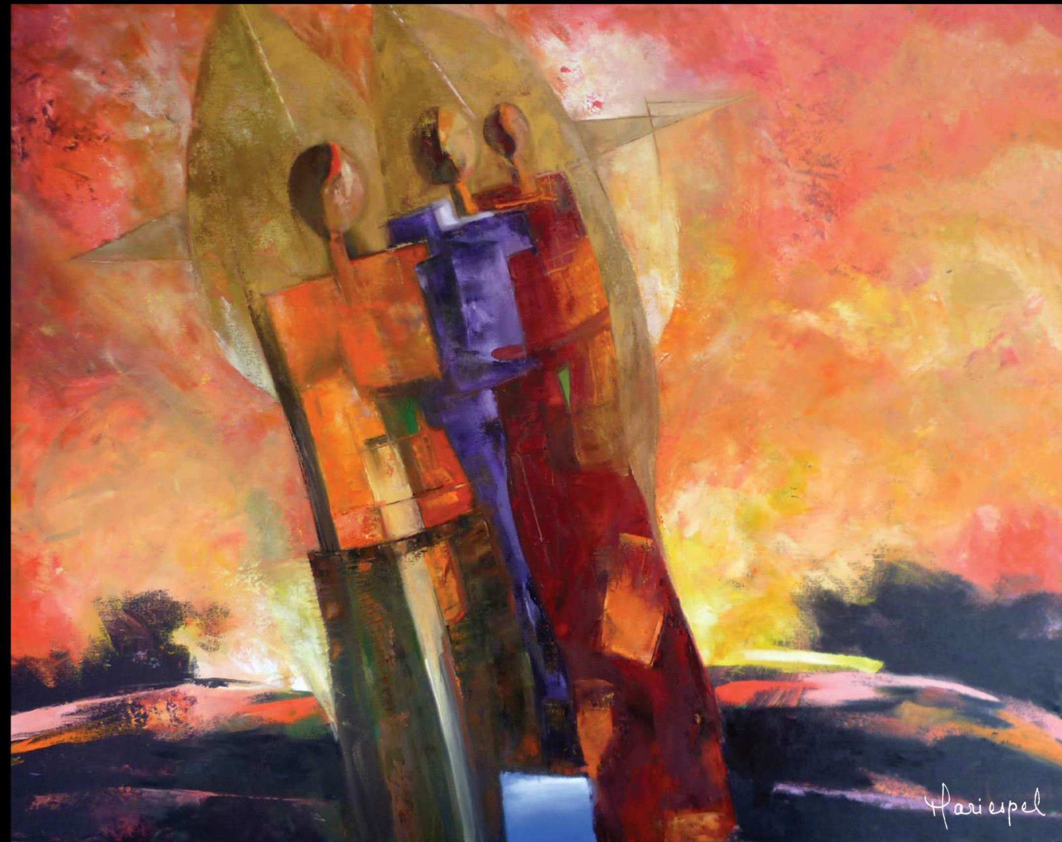
UNIDOS POR LA LUZ 2010 Óleo sobre lienzo 100 x 140 cms.