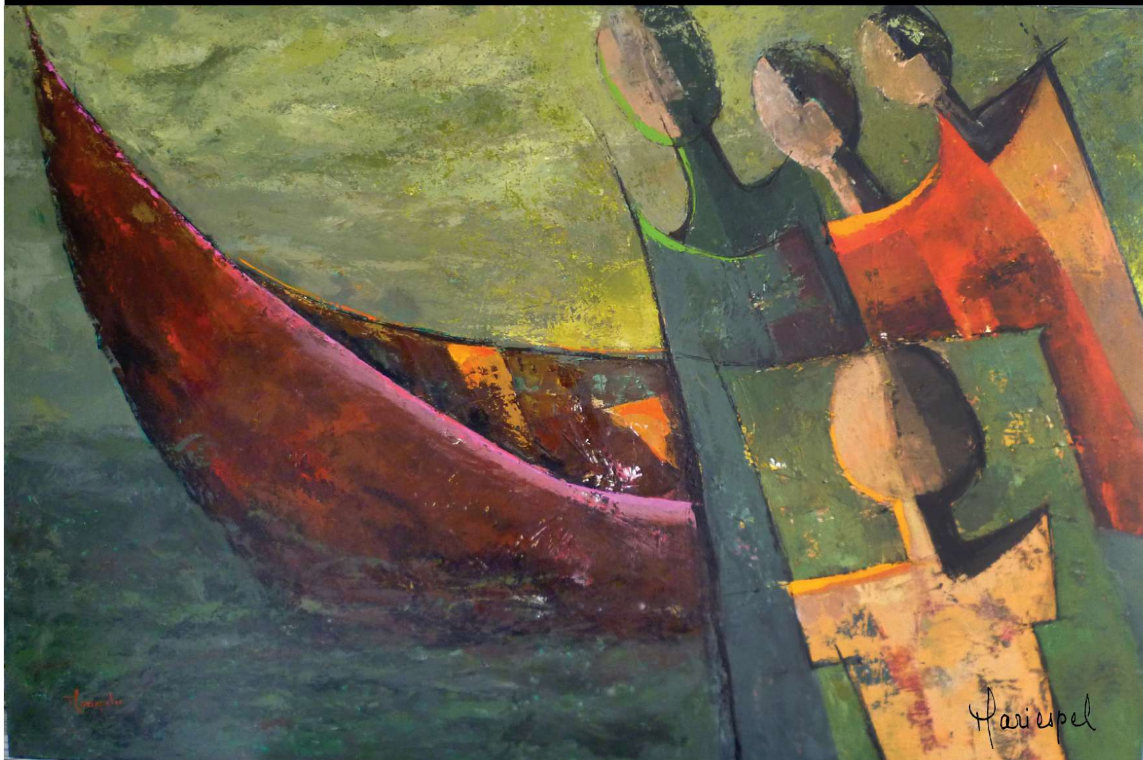
BARCAS SIN MUELLE 2009 Acrílico sobre lienzo 100 x 150 cms.