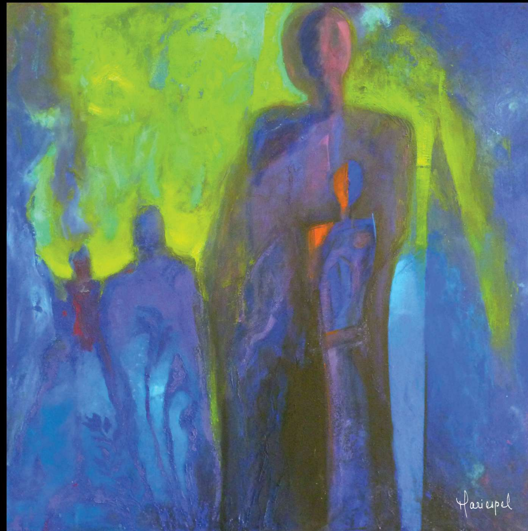
CAMINANTES 2012 Acrílico sobre lienzo 100 x 100 cms.