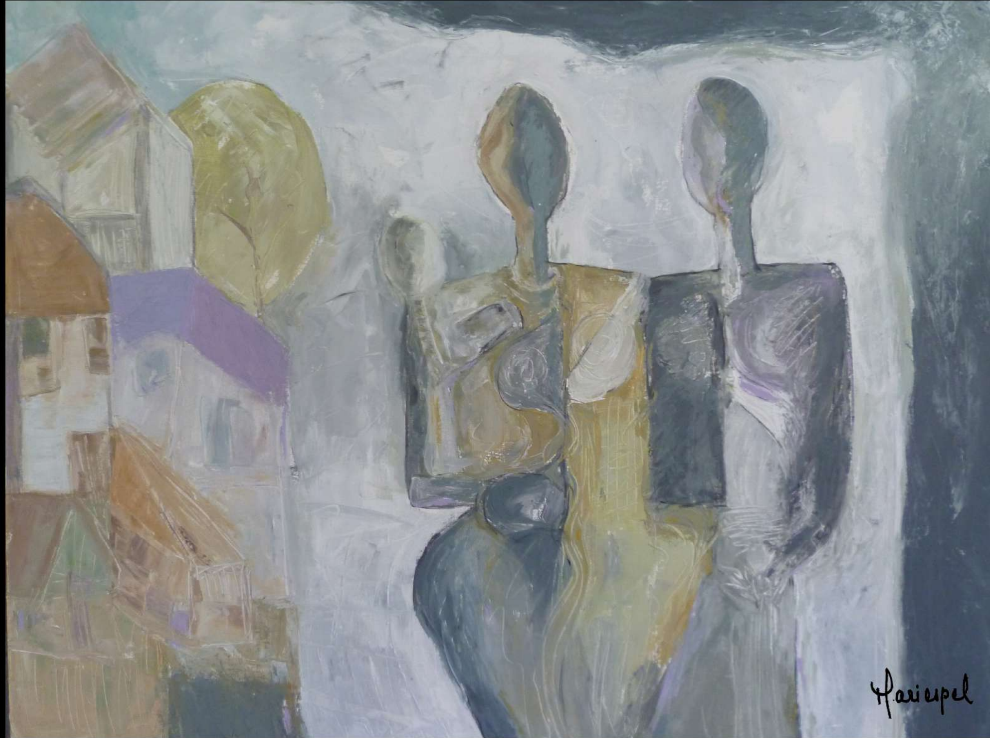
VIVENCIA URBANA 2012 Acrílico sobre lienzo 140 x 110 cms.