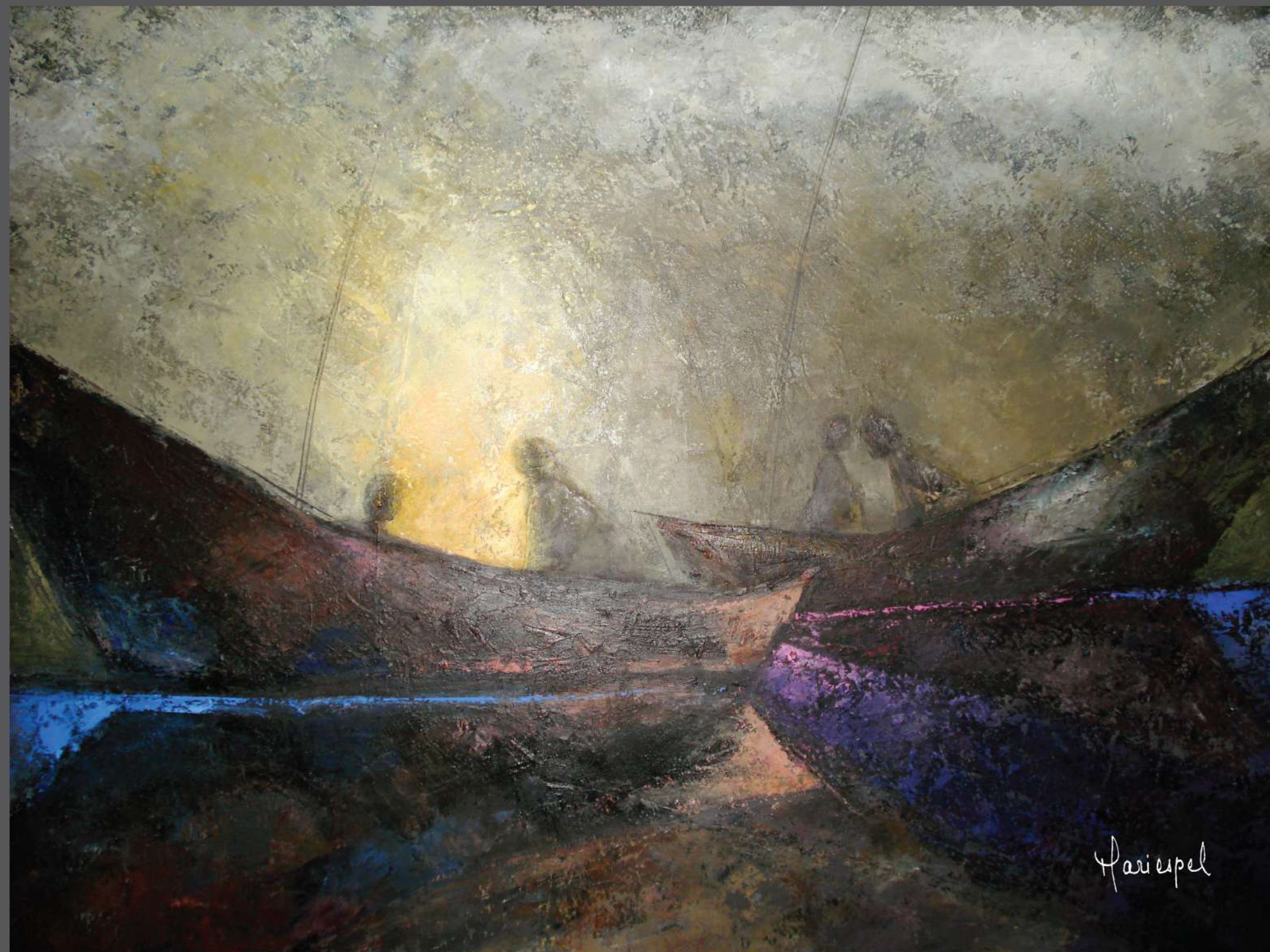
SOLEDAD Y SILENCIO 2010 Acrílico sobre lienzo 110 x 150 cms.