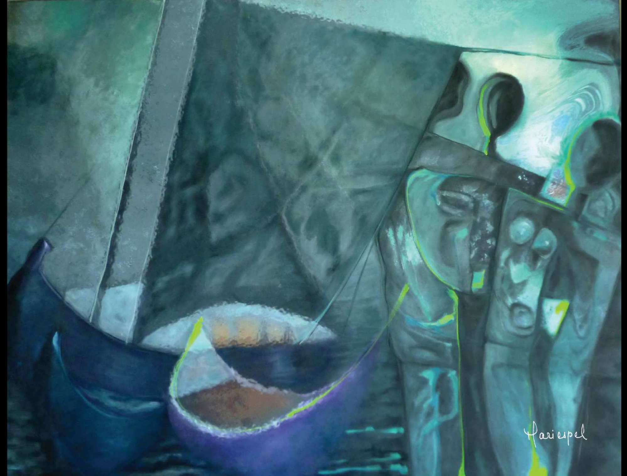
UN GUERRERO CONOCE SU CAMINO 2012 Óleo sobre lienzo 130 x 95 cms.