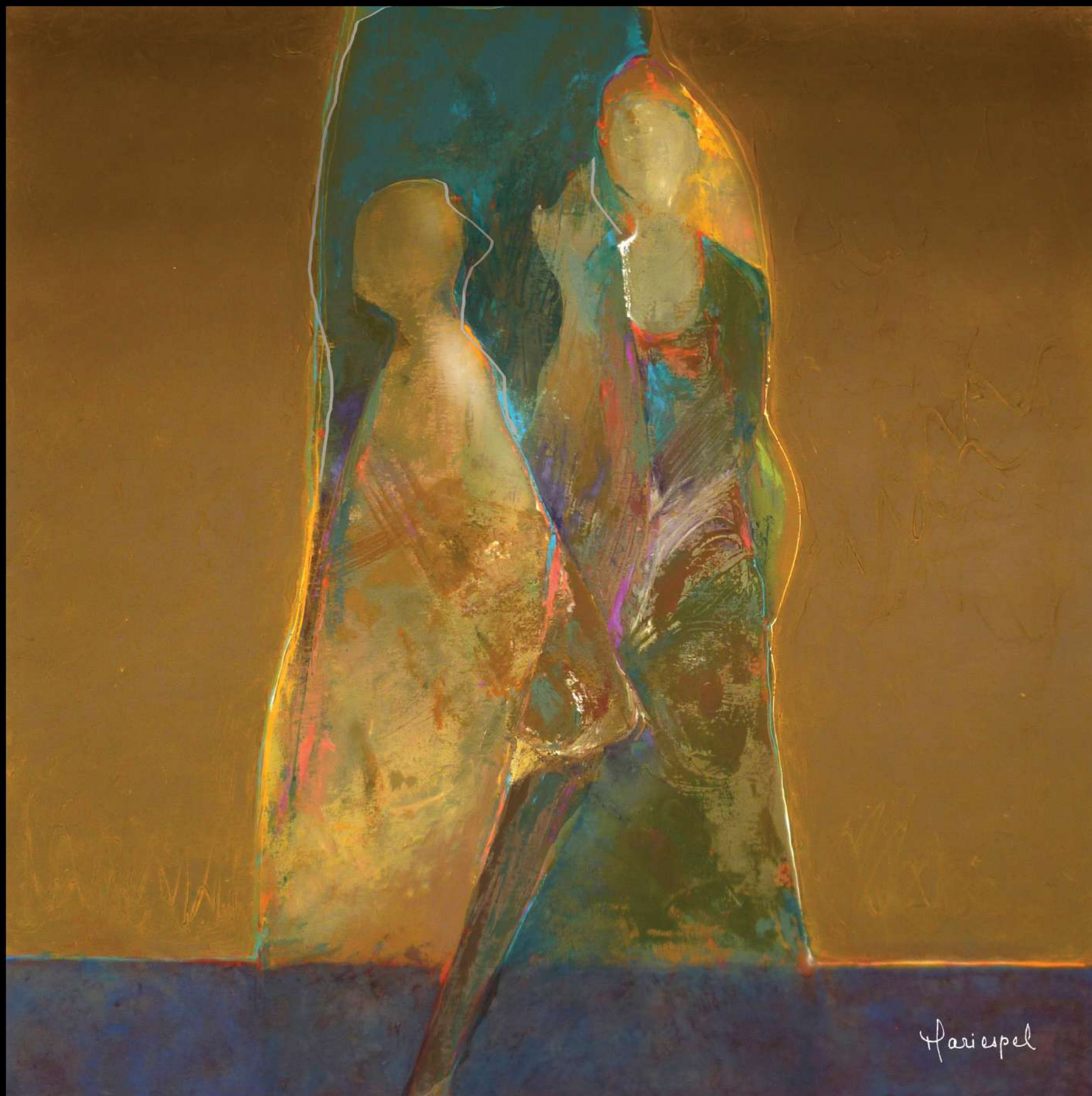
NOSTALGIA 2012 Acrílico sobre lienzo 100 x 100 cms.