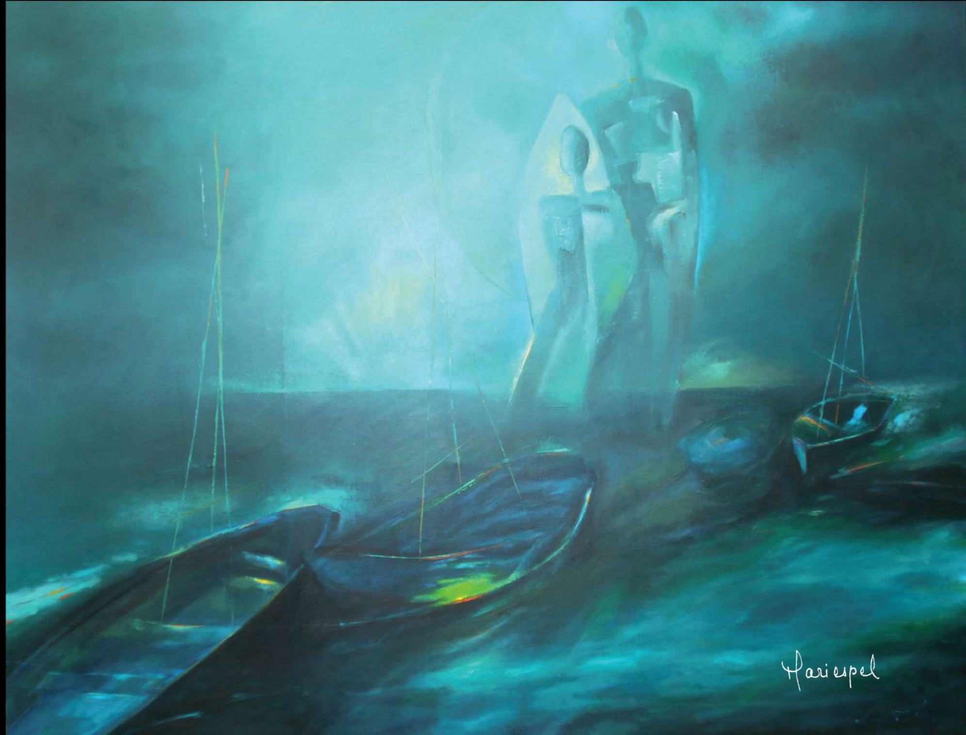
TIEMPO, SUCESIÓN DE COSAS 2010 Óleo sobre lienzo 100 x 140 cms.