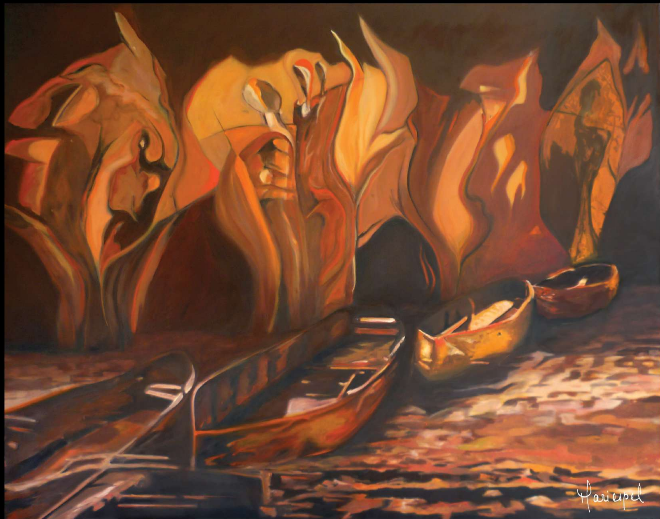
VIAJE SIN TIEMPO 2010 Óleo sobre lienzo 100 x 140 cms.