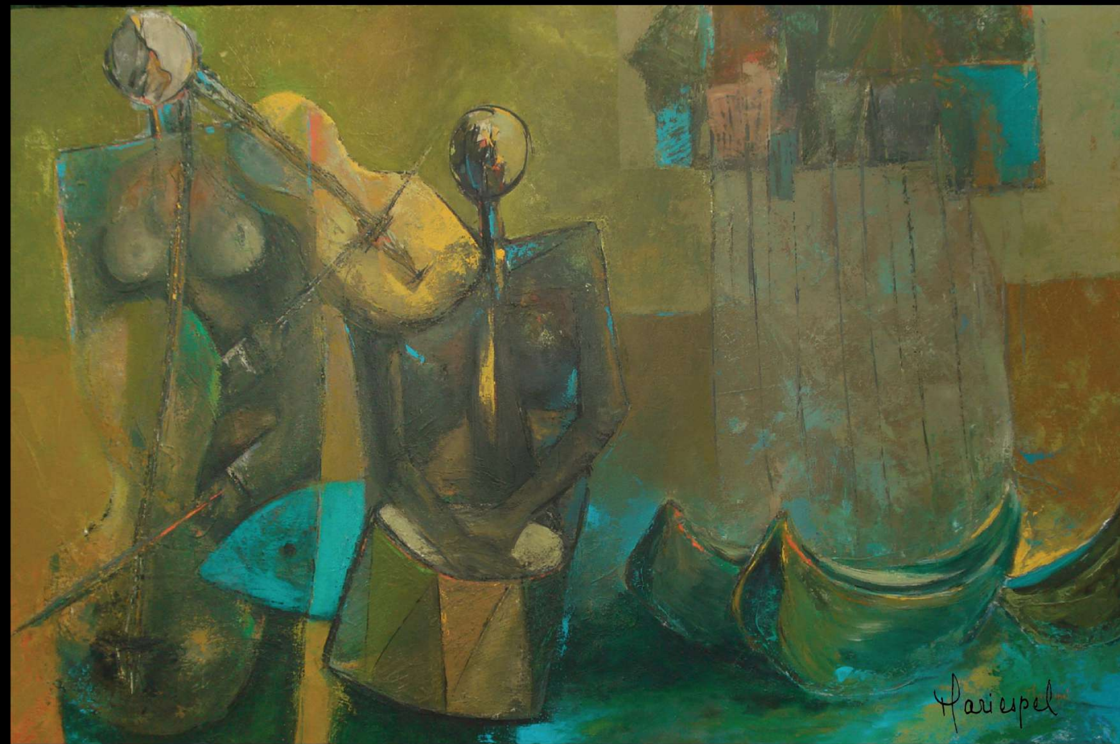
ELEVAN EL ESPÍRITU Y ENCIENDEN EL CORAZÓN 2010 Acrílico sobre lienzo 100 x 150 cms.