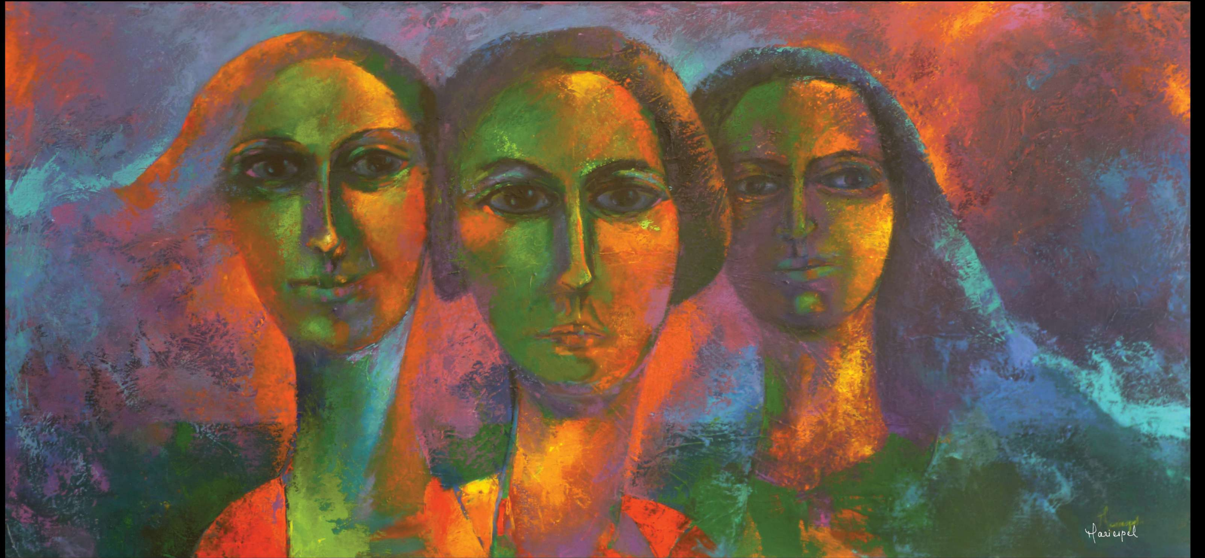
EUFROSINE, TALIA Y ANGLAE 2012 Acrílico sobre lienzo 180 x 84 cms.