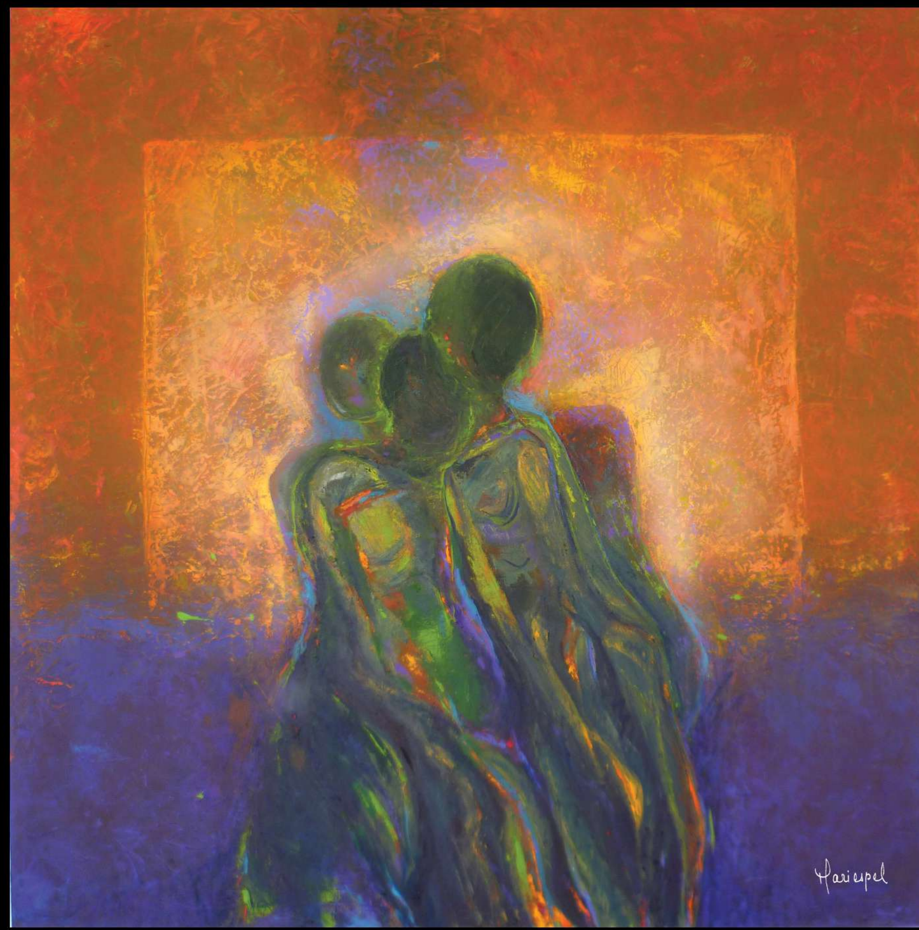
CONTRALUZ 2012 Acrílico sobre lienzo 100 x 100 cms.