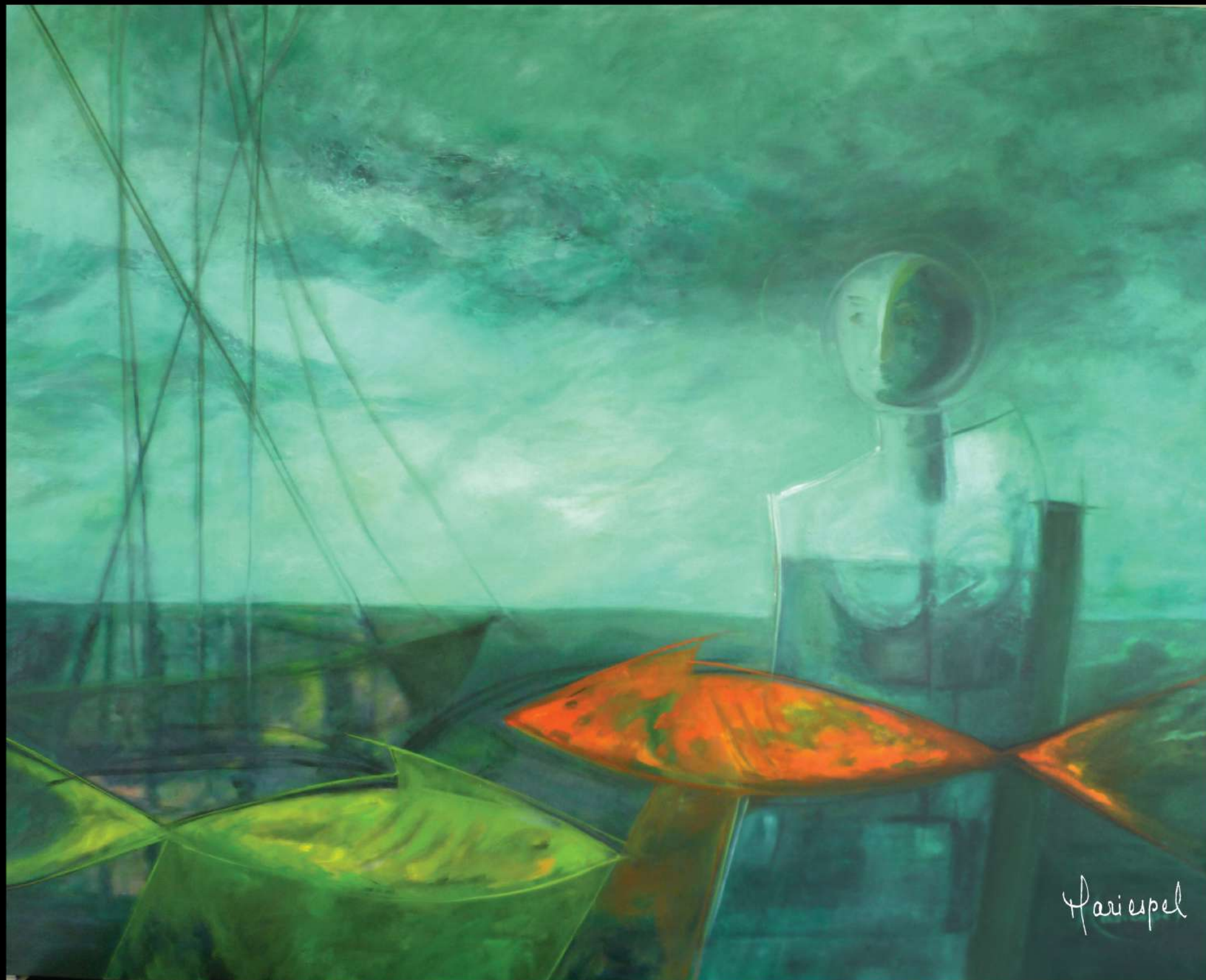
VIAJEROS DEL INFINITO 2010 Óleo sobre lienzo 110 x 140 cms.