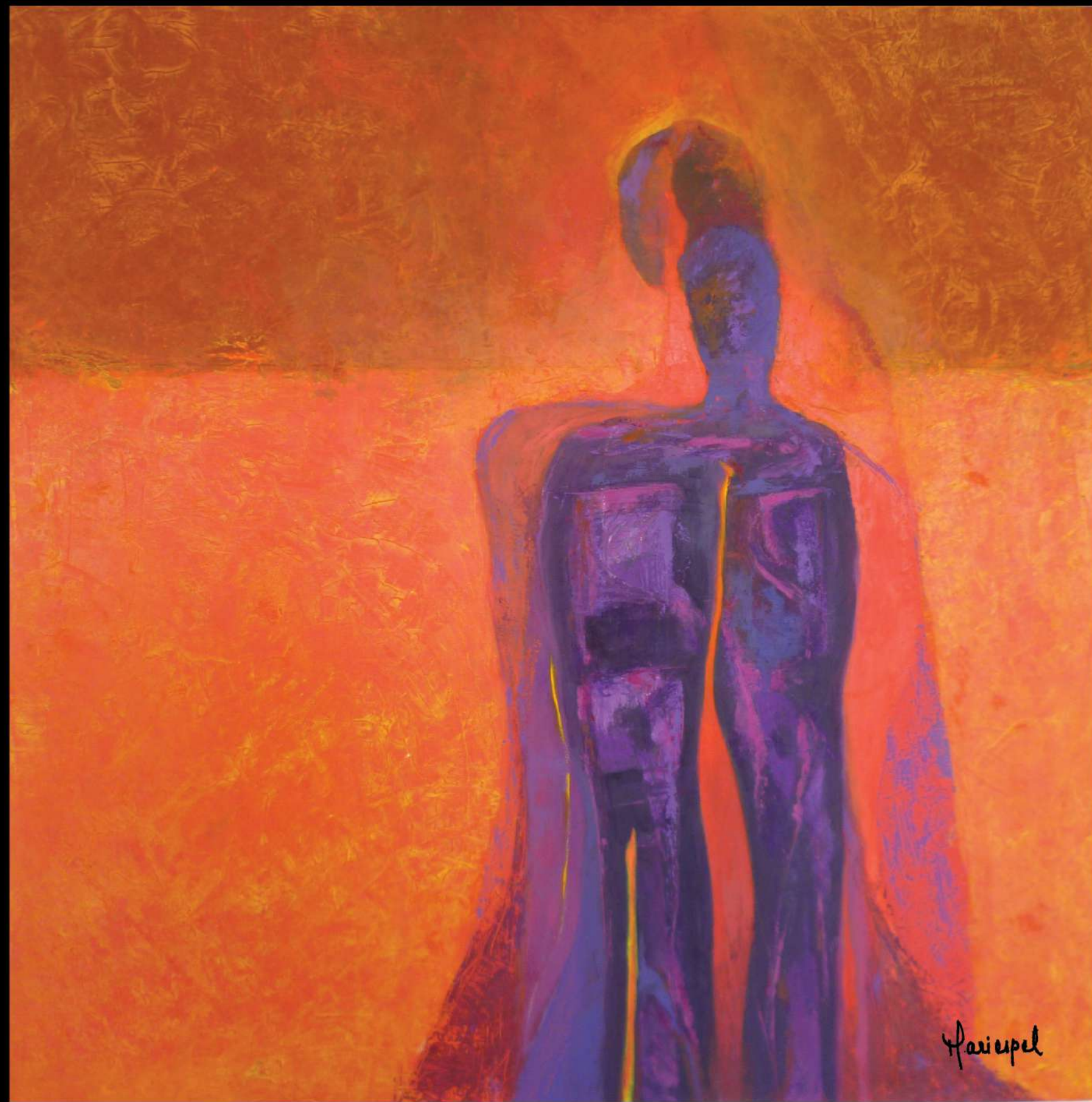
INTROSPECCIÓN 2012 Acrílico sobre lienzo 100 x 100 cms.