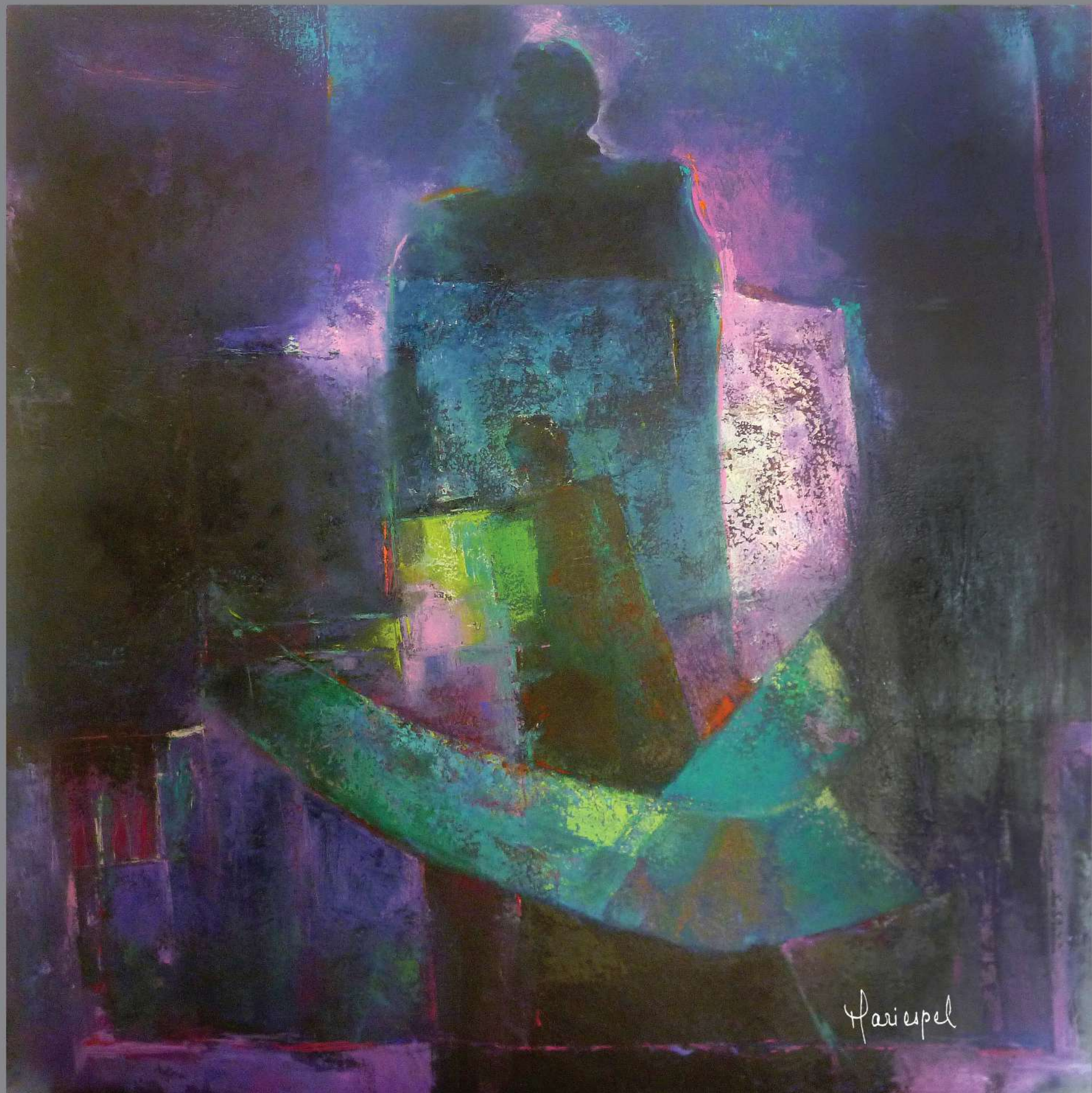
TESTIMONIO I 2011 Óleo sobre lienzo 100 x 100 cms.