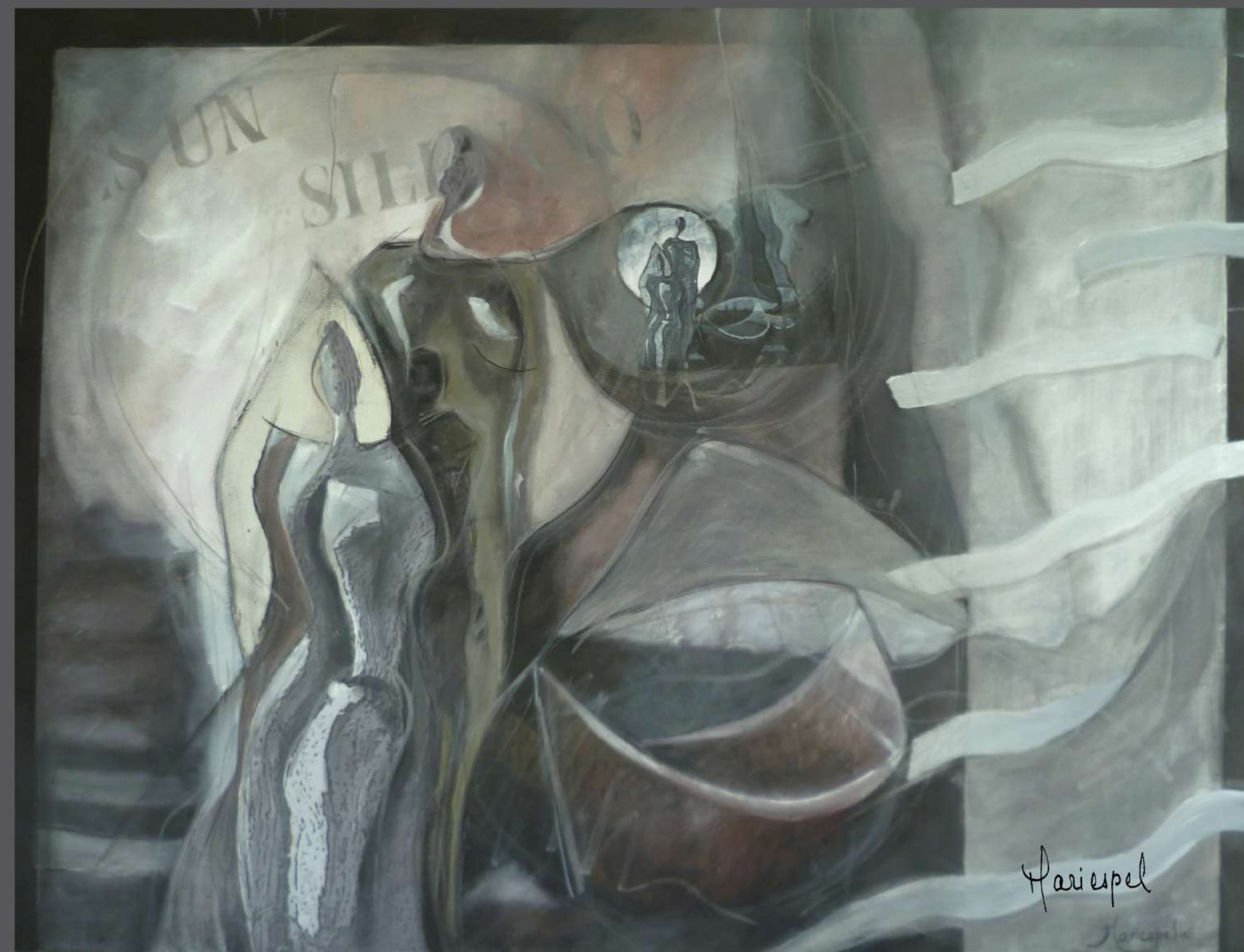
OTEANDO LA RUTA 2010 Óleo sobre lienzo 80 x 107 cms.